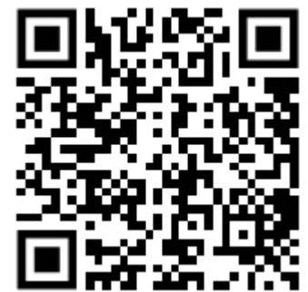
Zur Seite “Hochschuldidaktik” bei der HüW

Grundsätzlich gibt es keine festen Zeitpunkte, zu denen Angebote veröffentlicht werden. Die Veranstaltungen werden der HüW kontinuierlich von den anbietenden Hochschulen zur Freischaltung gemeldet. Insbesondere kurz vor Semesterstart finden aber vermehrt Veröffentlichungen von Angeboten für das folgende Semester statt. Schauen Sie daher gerne regelmäßig vorbei.